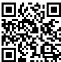
講座WEBページ インタビューやレポートなどを 掲載しています