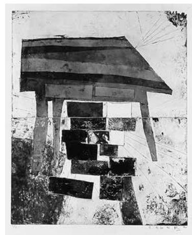
テーブルの下の私の荷物

エッチング、アクワチント、ドライポイント、コラグラフ 558mm × 450mm ed.12, a.p.3 2版2色刷り サマセット紙