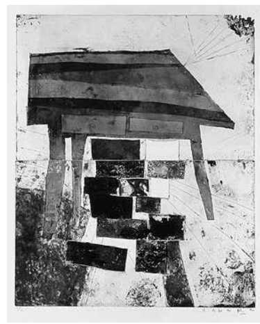
テーブルの下の私の荷物

エッチング、アクワチント、ドライポイント、コラグラフ 558mm × 450mm ed.12, ap.3 2版2色刷り サマセット紙